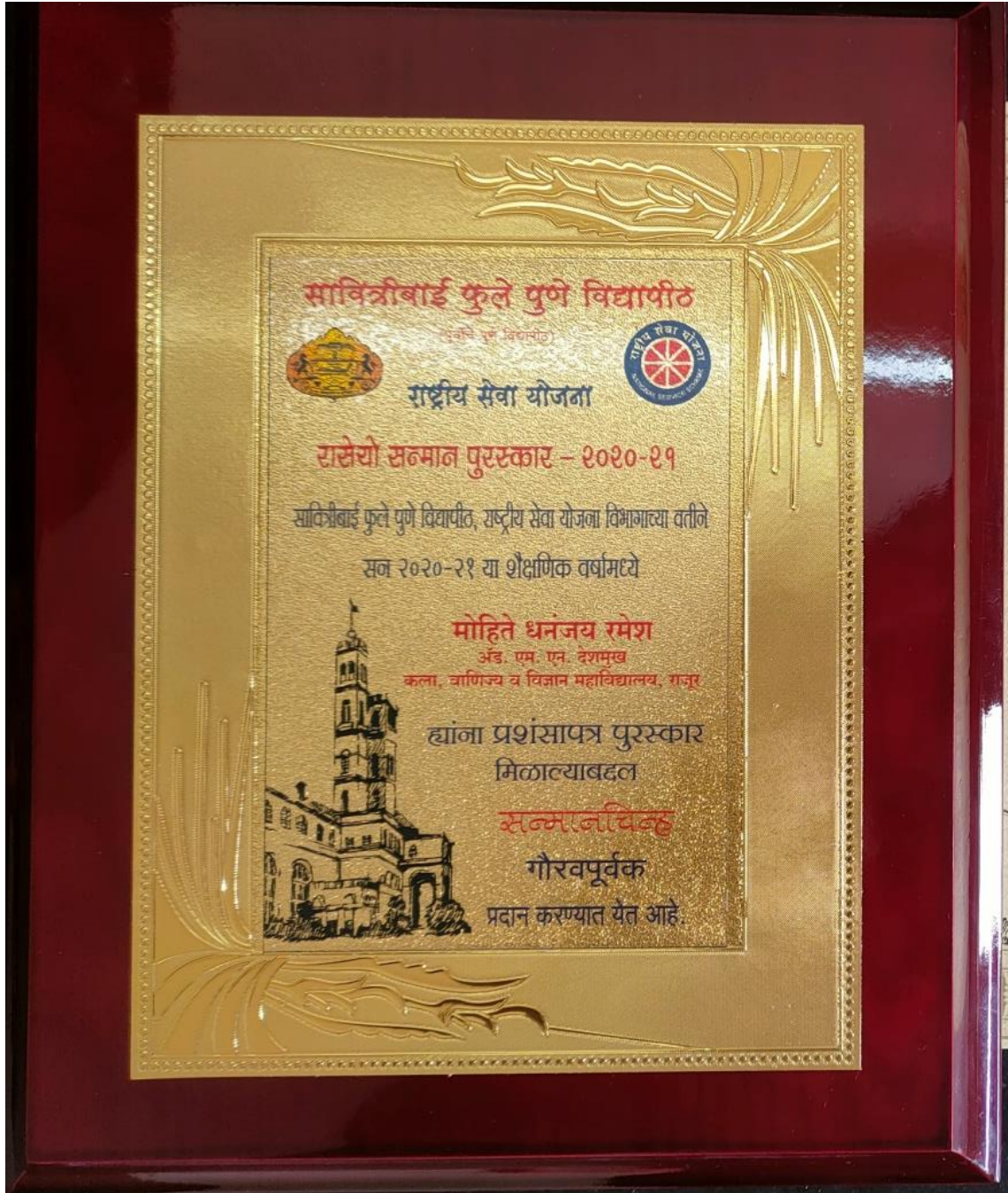
National Service Scheme Sanman Award 2020-2021