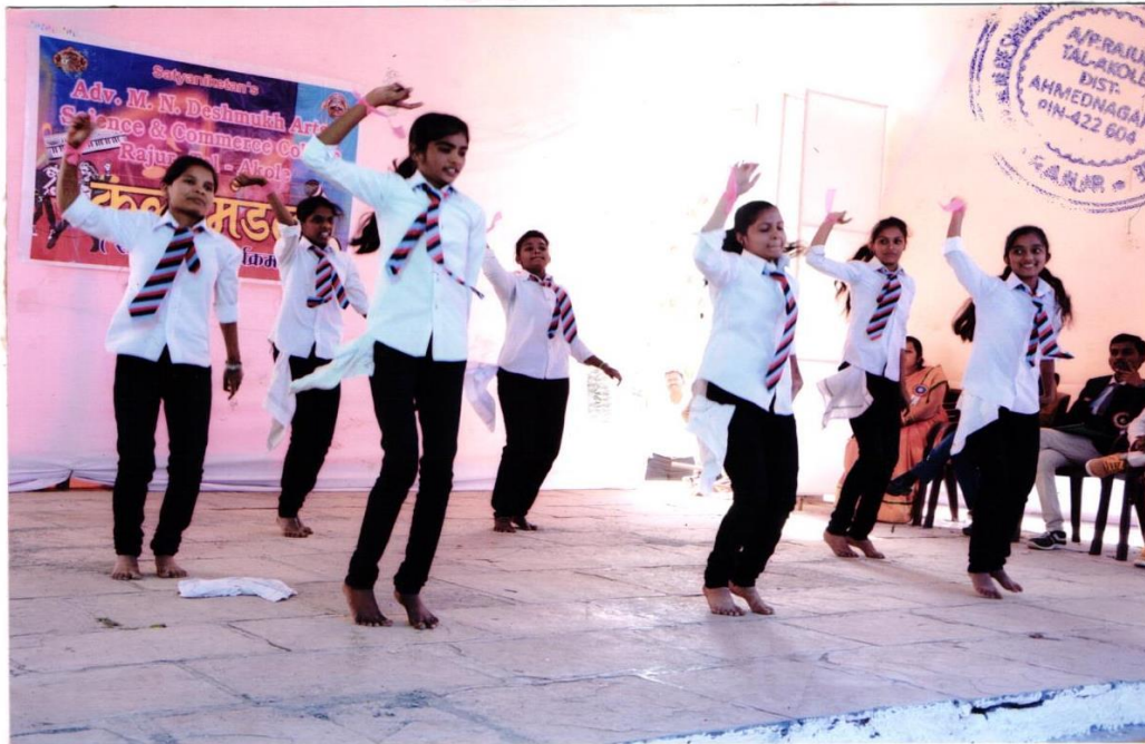
સોલ્જીલિક કાર્યક્રમ વિદ્યાર્થીની સ્વાસ્થ્યિક ગ્રામ કરાવવા