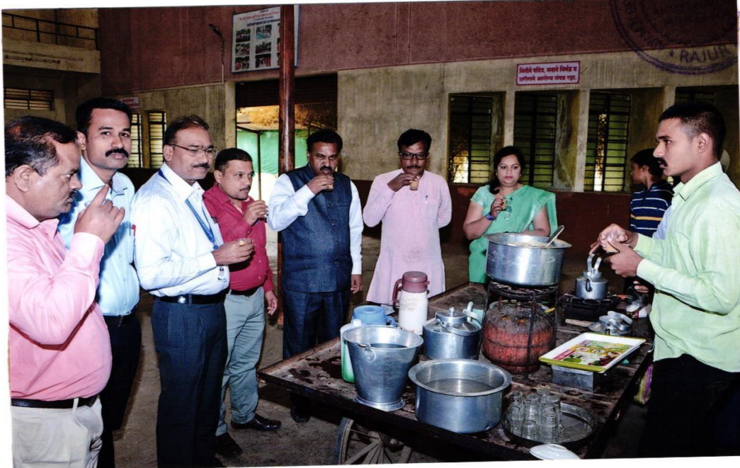
સાંજના ભોજન ૧૯-૧૯