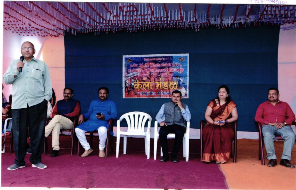
सन. १८-१९ कला मंडळाचे सोबळमिक कार्यक्रम उदघाटन भरलेली