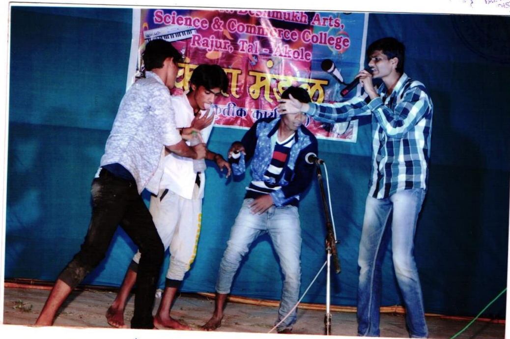
सन १९८०-८१ सांस्कृतिक कार्यक्रमांश एक जिकी सादर करताना विद्यार्थी