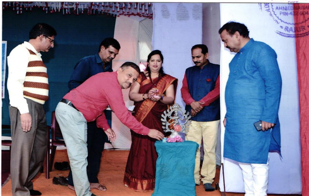
सन. १८-१९ सोबळमिक कार्यक्रम उदघाटन भरलेली