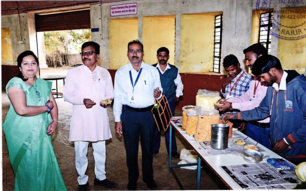
સાંજના ભોજન ૧૮-૧૯