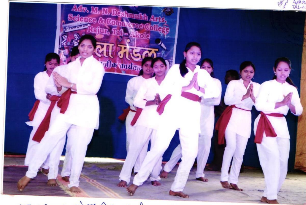
सन १९८०-८१ सांस्कृतिक कार्यक्रमांश सादर करताना विद्यार्थिनी