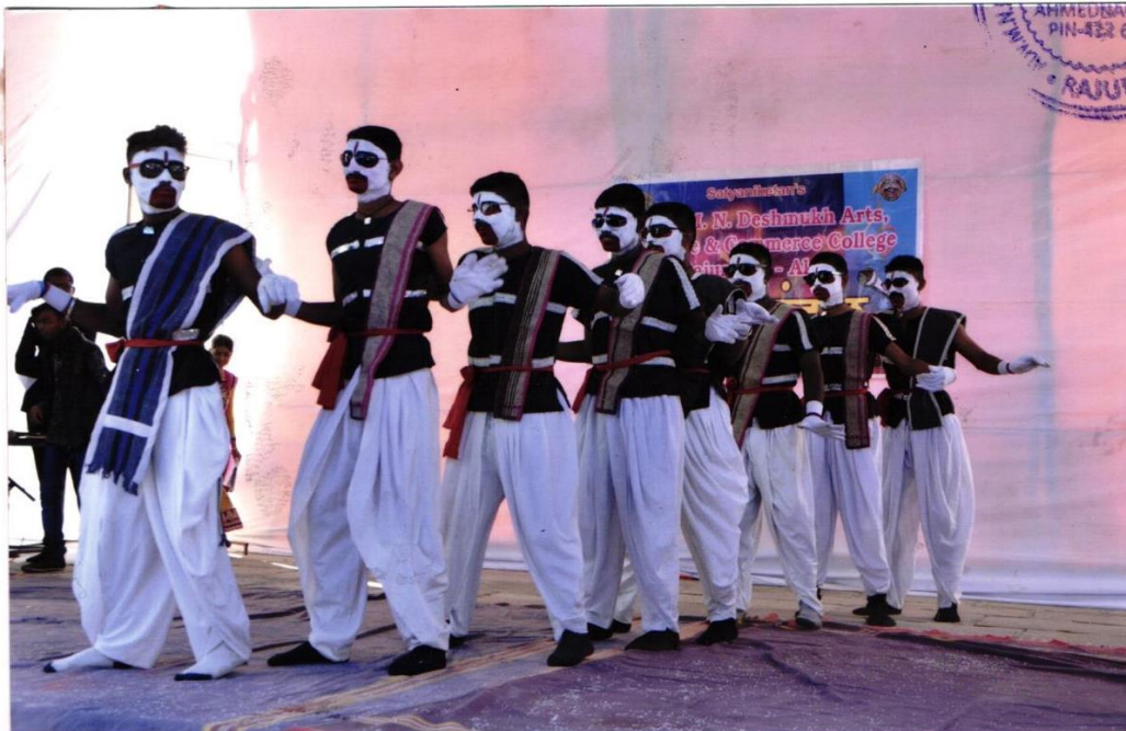
સોલ્જીલિક કાર્યક્રમ વિદ્યાર્થી સ્વાસ્થ્યિક ગ્રામ કરાવવા